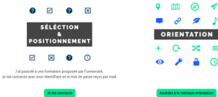
PRELUDE - La plateforme de pré-rentree Unicaen

En cliquant sur “Je me connecte” , l'utilisateur accède aux différents modes de connexion disponibles :