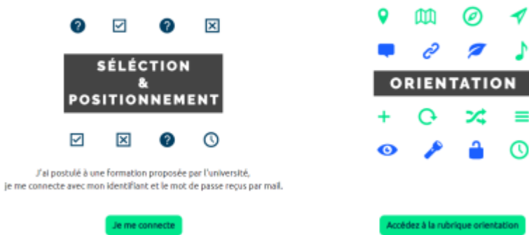
PRELUDE - La plateforme de pré-rentrée Unicaen

En cliquant sur “Je me connecte” , l'utilisateur accède aux différents modes de connexion disponibles :