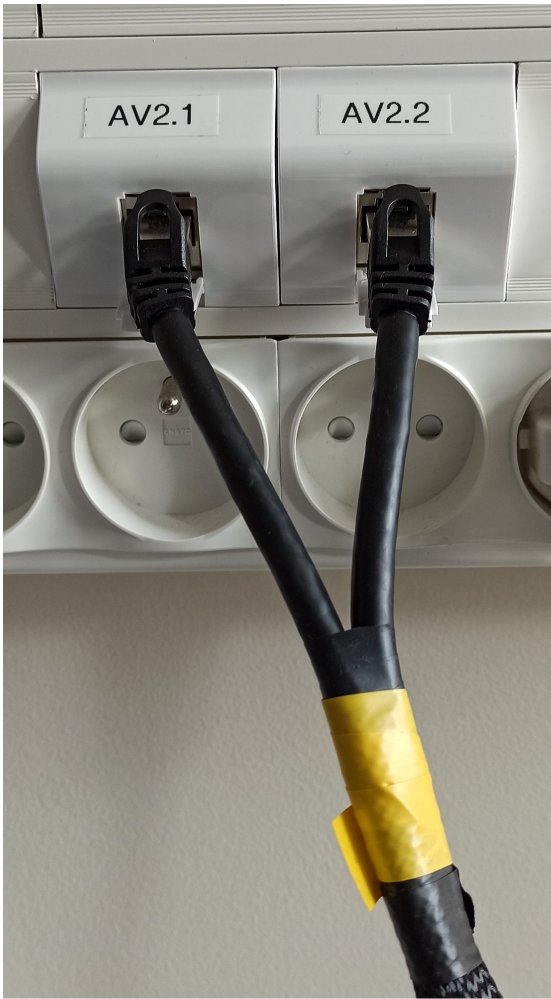
point de connexion mural